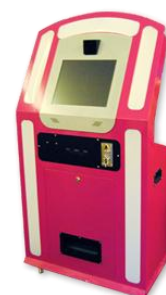
Fot. Model PB100