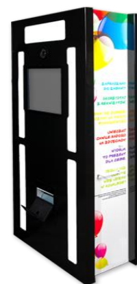
Fot. Model FB-002 BOX